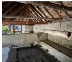
Lavoir & ferroir à Bourisp