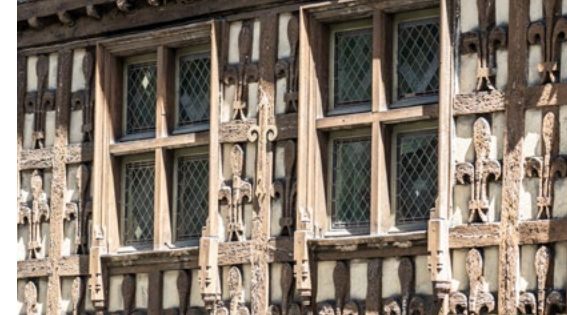
Maison des Lys d'Arreau