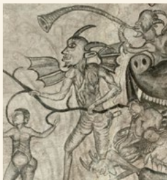
Peinture église de Vielle-Louron