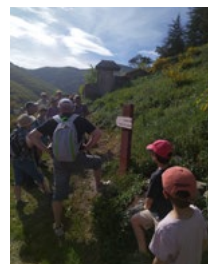
Rando Arreau- Jézeau