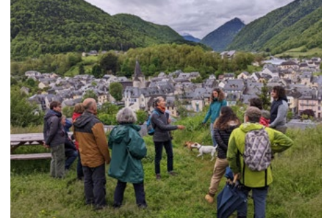
Visite du village d' Arreau