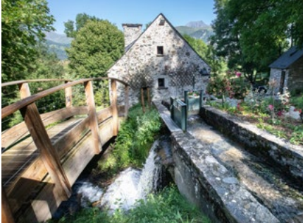
Moulin de la Mousquère de Sailhan